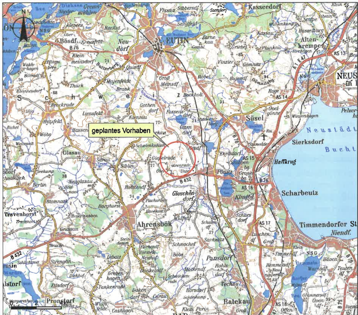
Abbildung 1: Lage im Raum

Die Erschließung im Betrieb der WEA erfolgt von Nordosten von der Eutiner Straße/K 55 aus, während die Anlieferung der Großkomponenten von Süden über eine temporäre Anbindung an die B 432 vorgesehen ist.